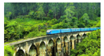
Nine Arches Bridge