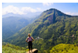
Little Adams Peak

標高 1041m の中央高地南端の峠の村。雲霧林の森は豊かな生態系を育む。風光明媚で素朴な村は欧米人バックパッカーに人気が高い。蝶の多い所としても有名。エラロックは片道 2 時間、リトルアダムスピークは片道約 1 時間。