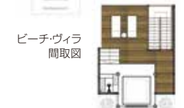
ビーチ・ヴィラ 間取図