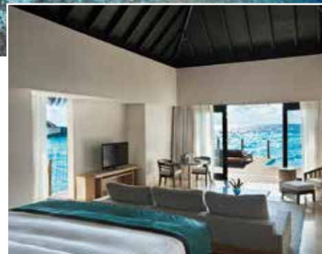
●コノッタ島／ガーファール環礁