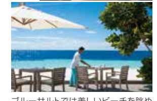
ブルー・saltでは美しいビーチを眺めながらバラエティ豊かなメニューをお楽しみ頂けます