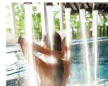
自慢のハイドロプール