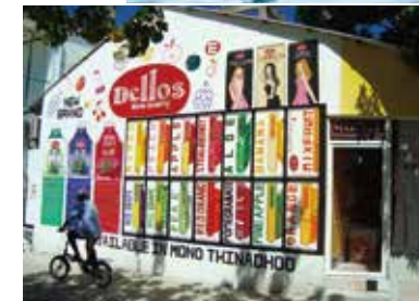
エクスカージョンでは他の島へ行く事も