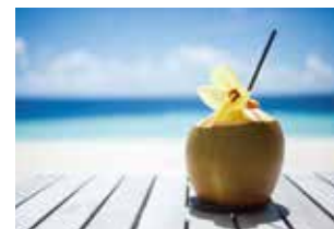
爽やかな日差しの中でカクテルをどうぞ

を完備。美しいハウス・リーフをご堪能いただけるシュノーケリングやダイビングなど充実したアクティビティの他、フィットネスやスパもご用意しております。レストランではモルディブ料理を始め、日本食もお楽しみいただける他、オール・インクルーシブプランもご用意しております。