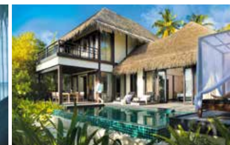
2ベッドルーム・ビーチ・ヴィラはファミリーにも