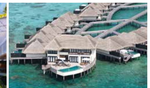
グランドコノッタ・ヴィラ