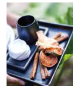
リゾートステイには欠かせない