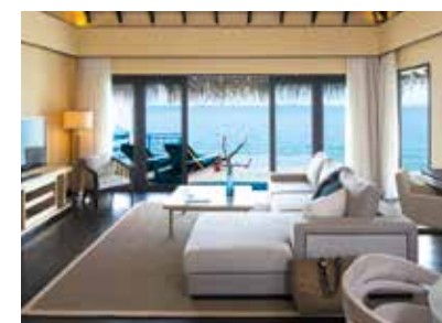
オーバーウォーター・ヴィラの広々としたリビング