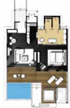
オーバーウォーター・ヴィラ間取図