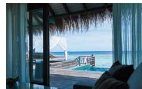
オーバーウォーター・ヴィラのデッキ