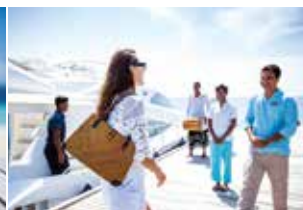
スタッフがあなたかくお迎えします