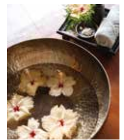
至極のリラクスの時間をどうぞ