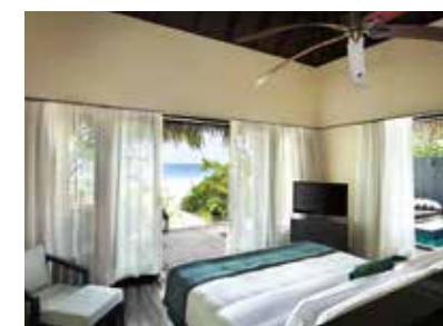
ビーチ・ヴィラのベッドルームからはビーチが