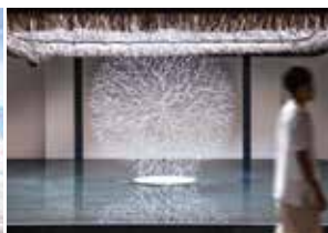
開放的で美しいロビーエリア