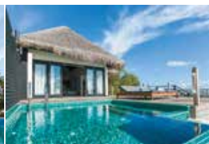
全てのヴィラにプライベートプール