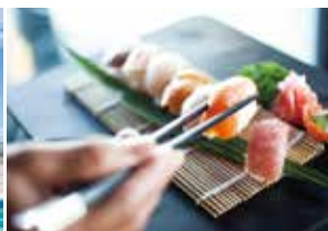
寿司をはじめとする日本食もご用意しております