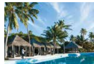
リゾートプールにはカバナやバーも